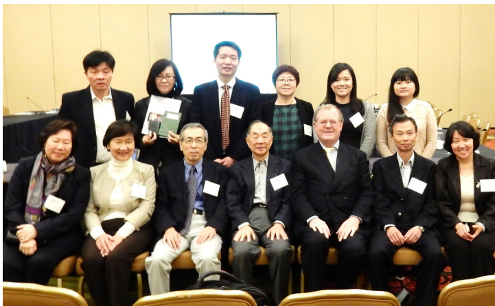
ILSI Taiwan 部分與會人員與亞洲分會代表合影。